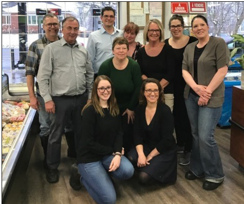
Sur la photo les propriétaires et le personnel.